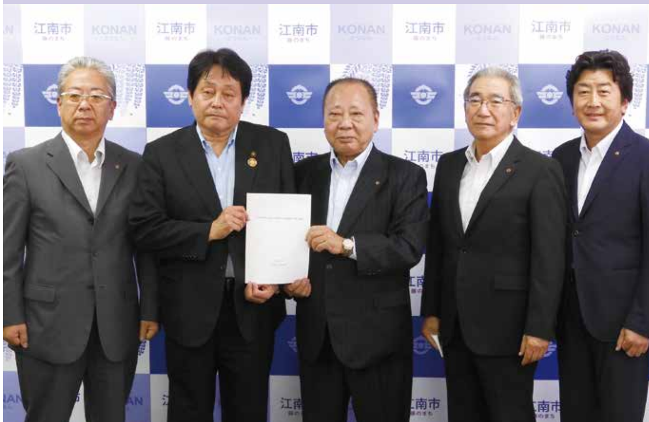
澤田江南市長（左から二人目）へ要望書を手渡す松永会頭ら

江南商工会議所は、7月20日に江南市役所を訪問し、松永会頭より澤田江南市長へ要望書を提出しました。