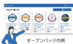
オープンバッジの例

座学だけでは身に付かない「即戦力になるためのスキル」に重点を置いた圧倒的なワーク、アウトプット中心の学習デザイン。知識の定着だけではなく、ビジネス思考力も鍛えます。