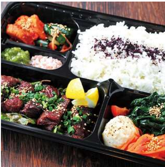
和牛カルビ弁当 1,080円