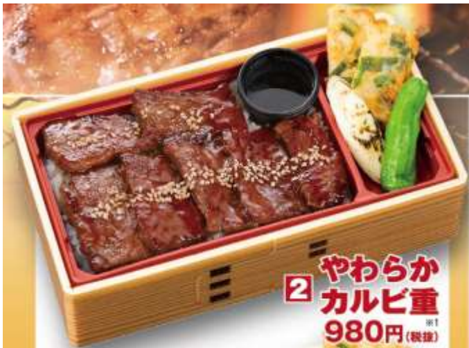
やわらかカルビ重 1,058円