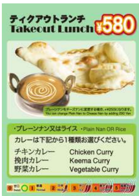
ナンとカレーのセット 580円