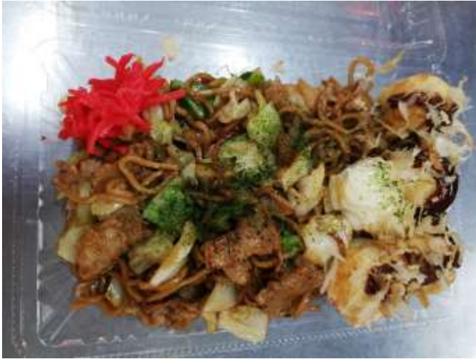
たこそば 肉入 500円