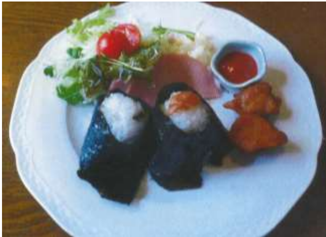
おむすびセット 500円