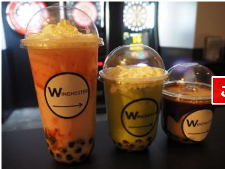
いちごミルクMサイズ 483円