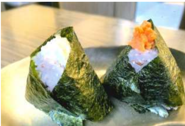
おにぎり 1個 320円、2個 530円