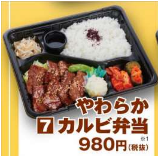
やわらかカルビ弁当 1,058円