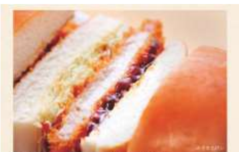
みそカツパン/カツパン ¥880~¥940