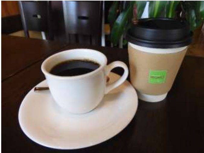
プレミアムブレンド 五条川ブレンド 400円~