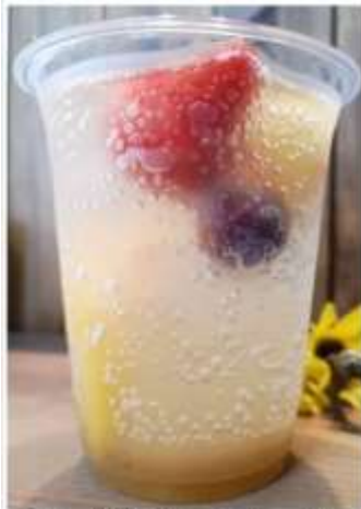
フルーツジンジャーSoda 550