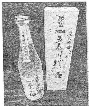
江南商工会議所会頭に輝いた「清酒熟成純米吟醸」赤川枝田錦