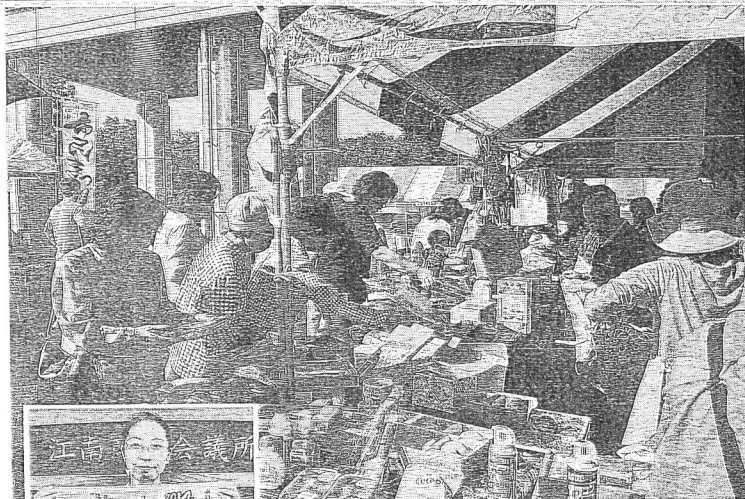
(写真上)にぎわう昨年の「江南市民まつり」 (写真左)「江南市民まつり」のポスター

江南商工会議所が運営する「コーナンスイーツ」は、現在「種類を展開。今夏に追加したバニラスイーツ」を販売している。今年も期間中の2日間に限り販売される。表示価格あり。販売時間は、10月4日(土)10時～16時、5日(日)10時～16時。江南市民まつり会場(江南市三井町)で開催される。